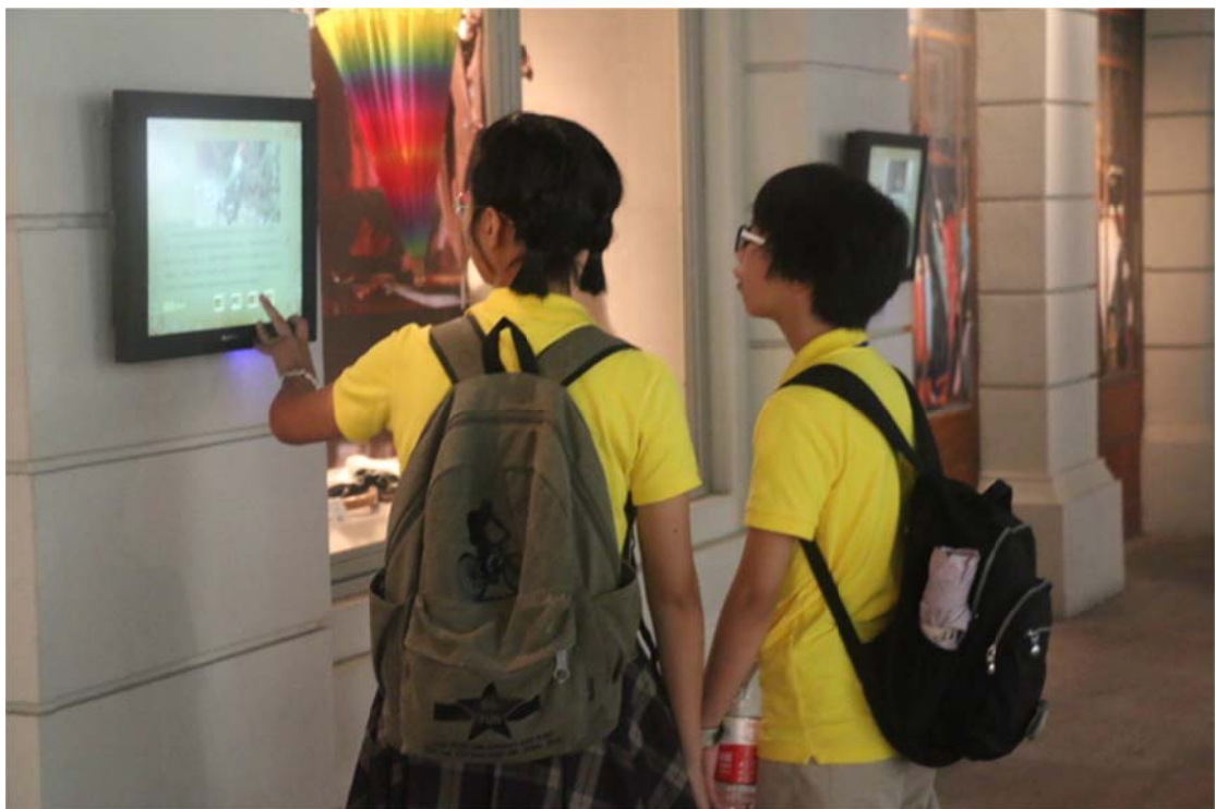
在参观博物馆的日程中，营员们欣赏了藏品与文物，更加深切地体会到杭州深厚的文化底蕴，同时也让营员们更进一步了解历史，品味文化。