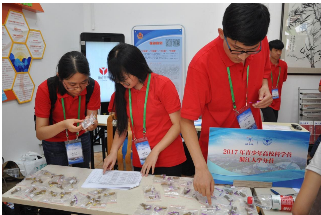
(志愿者报到现场工作)