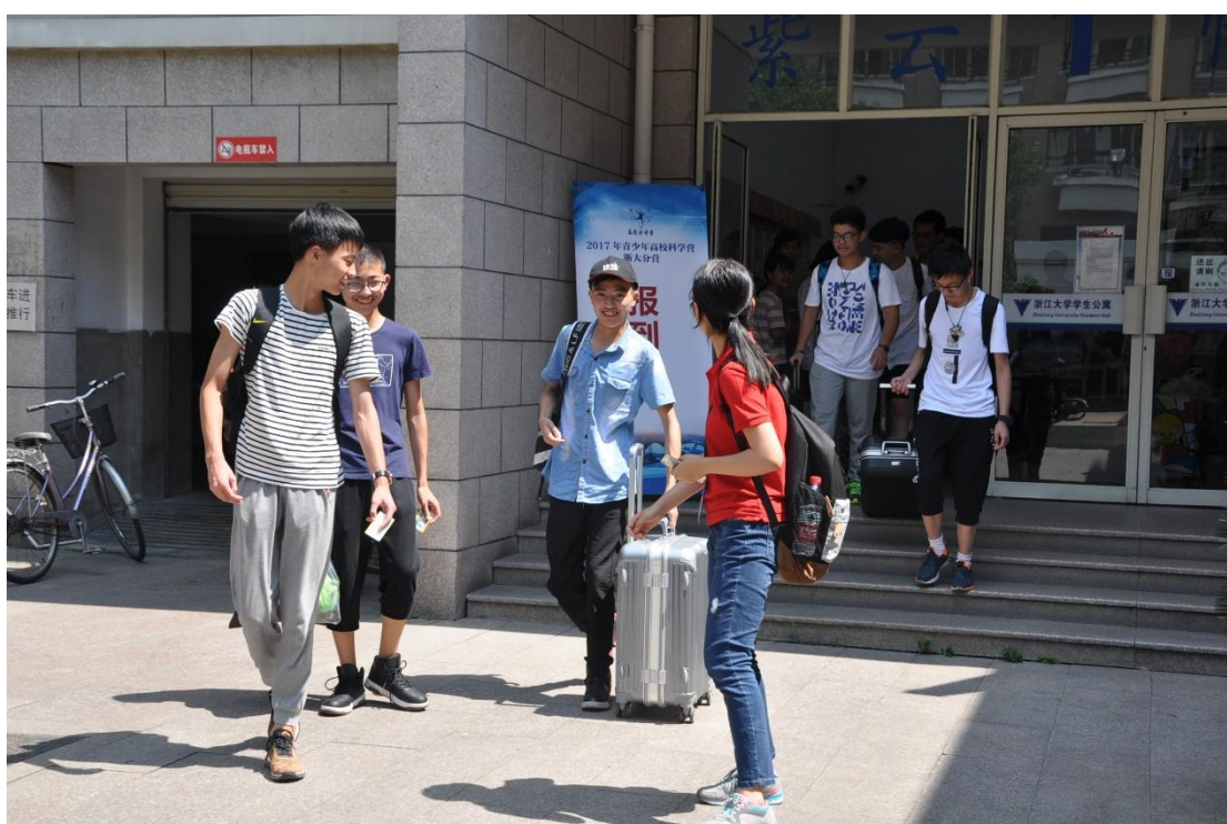
(志愿者带领营员前往寝室)