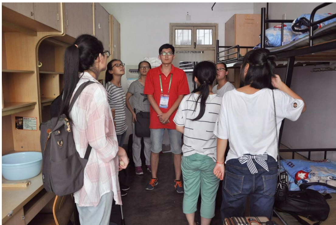
（志愿者告知营员注意事项）