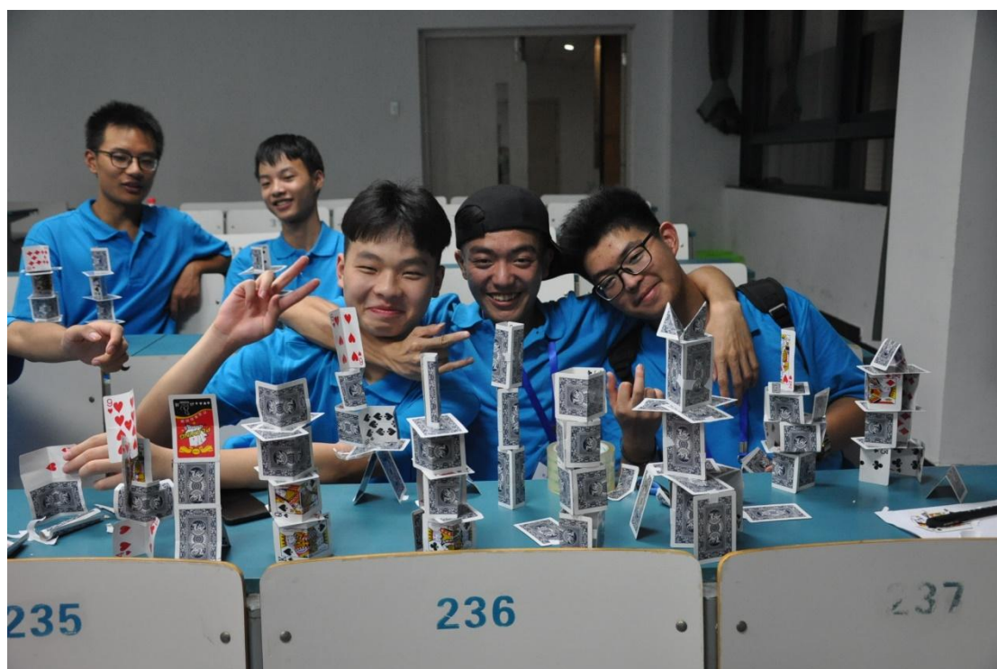
(营员与他们的作品合影)