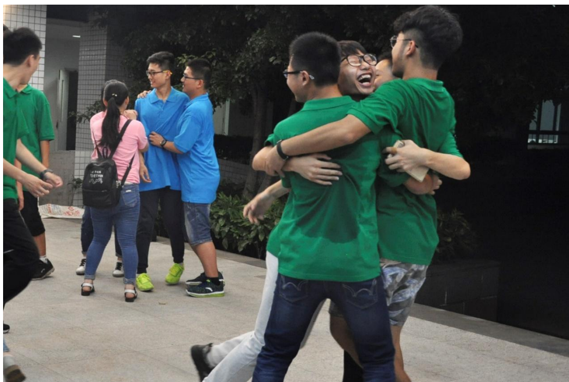
（小组破冰游戏火热进行中）