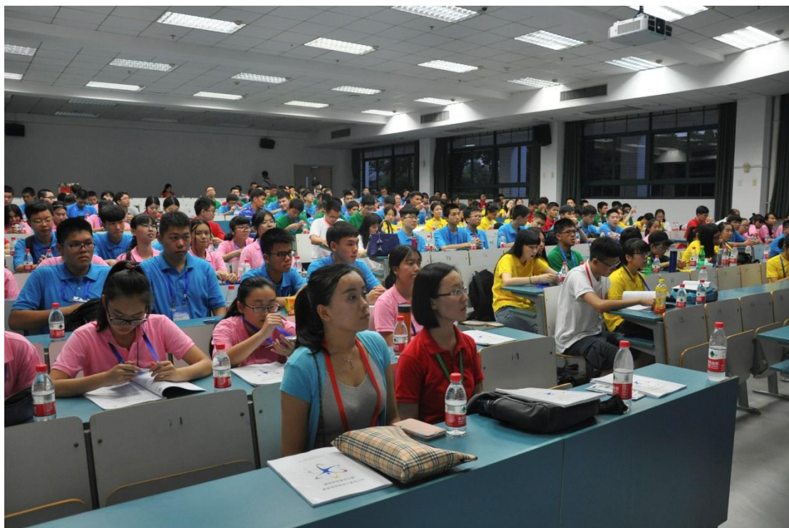
（正在聆听活动介绍的营员们）

晚上 9 点半左右，破冰晚会接近尾声，营员们在志愿者带领下有序地回到了各自的宿舍，第一天的活动就此结束。