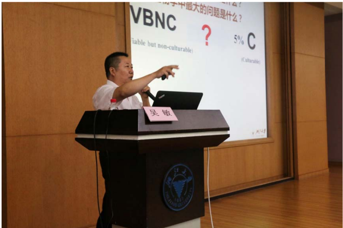
(国家级教育名师吴敏教授演讲)

下午一时三十分，在国家级教学名师吴敏教授幽默的语言中，开始了下午的专题报告——“快乐地学习，与梦飞翔”。吴敏教授用生动的语言与有趣的例子为大家展示了生命科学的魅力，现场互动频繁，笑声不断。吴敏教授首先提到，学生应该先做人后做事。同时又提出，心态决定潜能发挥，好的心态是成功的基础。