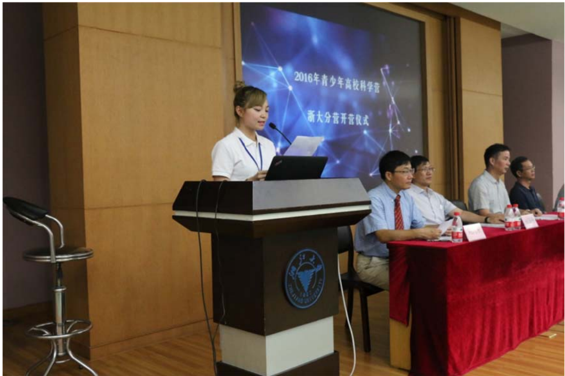
(带队老师代表发言)