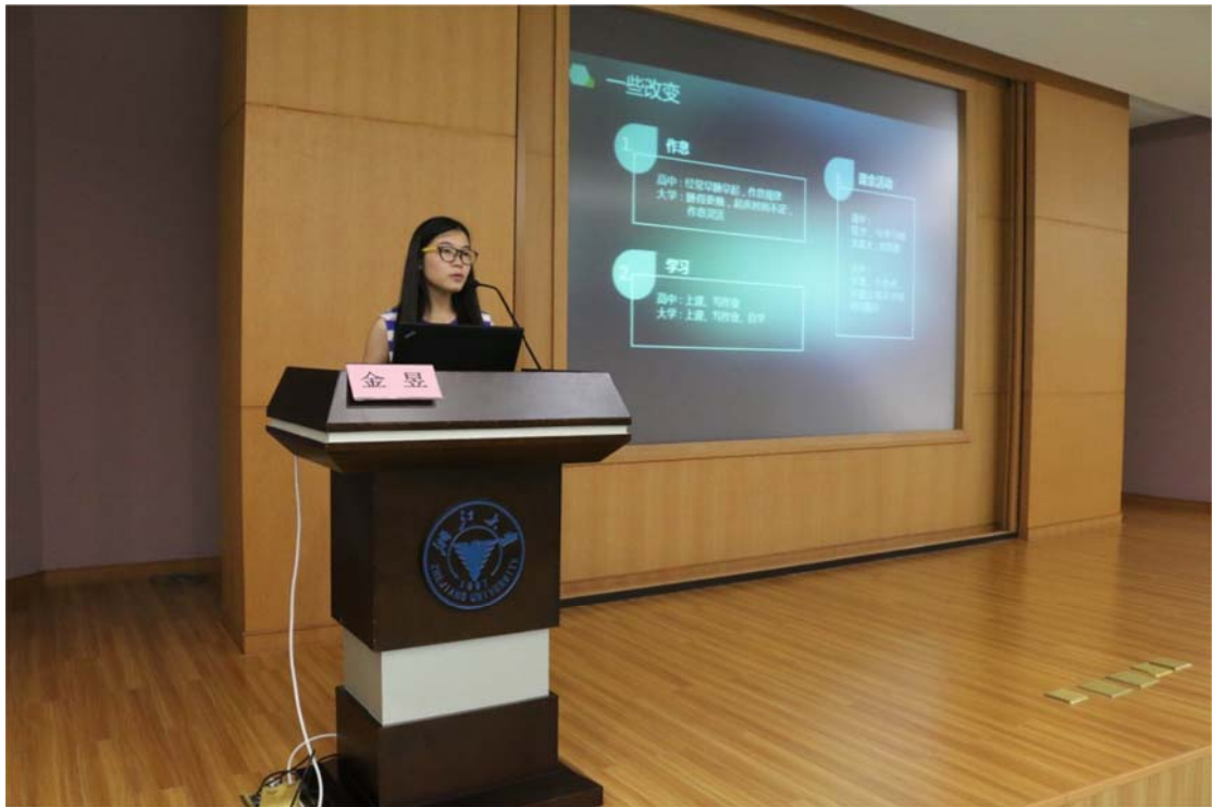
(学姐为同学们传授经验)