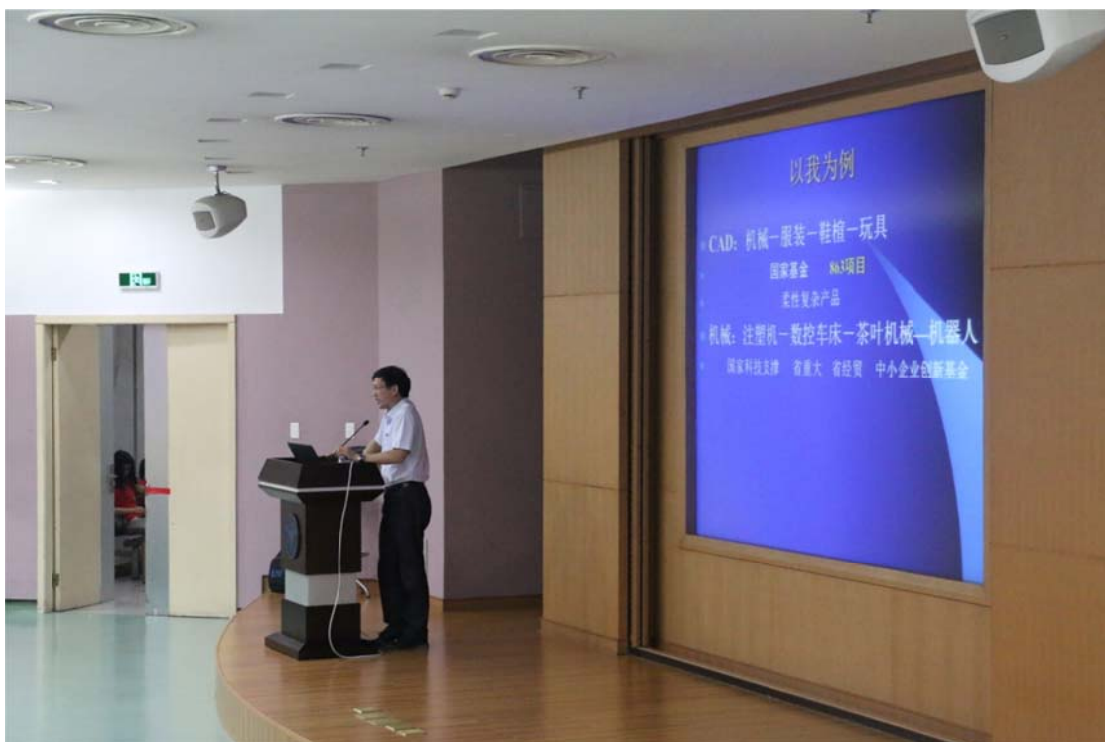
（国家级教育名师陆国栋教授演讲）

上午十时，国家级教学名师陆国栋教授为科学营营员们作了关于创新能力的专题报告，以亲身经历告诉大家，提出新概念的重要性。提出在当代中国，创新能力对国家发展的重要性，并提出对学生的创新意识与能力的培养应放在教育积极重要的位置。同时强调了浙江大学“以人为本、整合培养、求实创新、追求卓越”的教育理念。